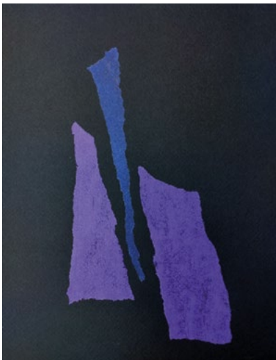
José JANSSEN « Sans titre »