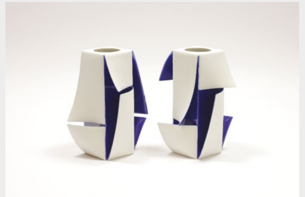
« Flip Glaze »

Atsushi espère encourager les perceptions permettant d'atteindre la paix intérieure, l'équilibre et une vie joyeuse.