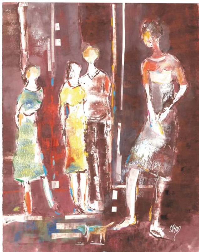
« I'm in love »