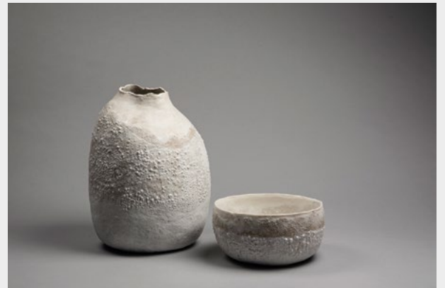
« Dérobée »

Les sculptures de Flore LOIREAU se promènent à la lisière de l'abstraction et de la référence à la nature. L'émail est à base de frêne, émail qui rappelle les métaux naturels patinés par le temps.