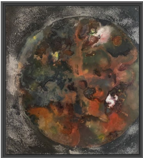
« Terre univers IV » (sables)

Alain PLÉSIAT développe ses créations en établissant un dialogue permanent et original entre le sable et fer, dialogue qui ouvre sur une réinterprétation contemporaine du sens profond de « l'inerte en errance ». Ses tableaux de sable composés avec des minéraux naturels sont autant de fragments de sols qui racontent des histoires millénaires : beauté et instabilité de la matière, traces éphémères du passage du vivant, empreintes des objets déposés par le vent ou les courants marins. Ces échouages imaginaires prennent alors la forme de sculptures en métal oxydé au caractère énigmatique, comme autant de témoignages de notre fragile présence sur cette planète.