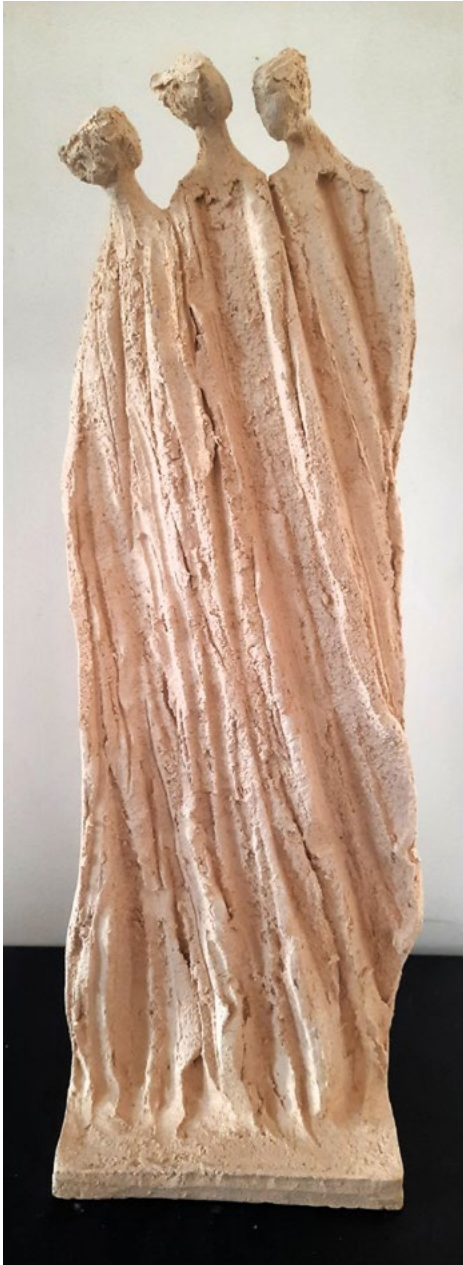
« Miria »