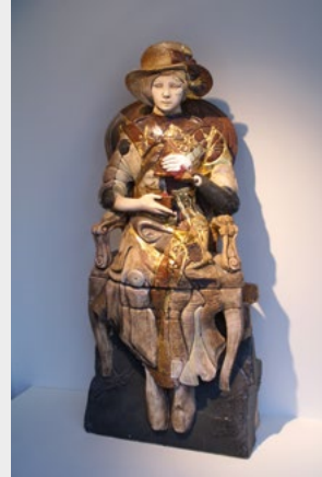
« La poupée au chapeau »

58 route de Frontenay, 39210 MÉNÉTRU-LE-VIGNOBLE