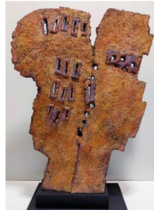
« Entre raison et imaginaire »

La terre est un univers que j'ai découvert dans un désir de respiration. Ce voyage méditatif au cœur des mystères des argiles et des chamottes m'a conduit progressivement vers un espace minéral onirique propice à la quête d'une expression symbolique.