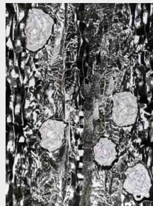
« Lichen », collage papier photocopiés, 2024, impression sur bâche 125x165 cm

Rue du vieux moulin, 67420 COLROY LA ROCHE